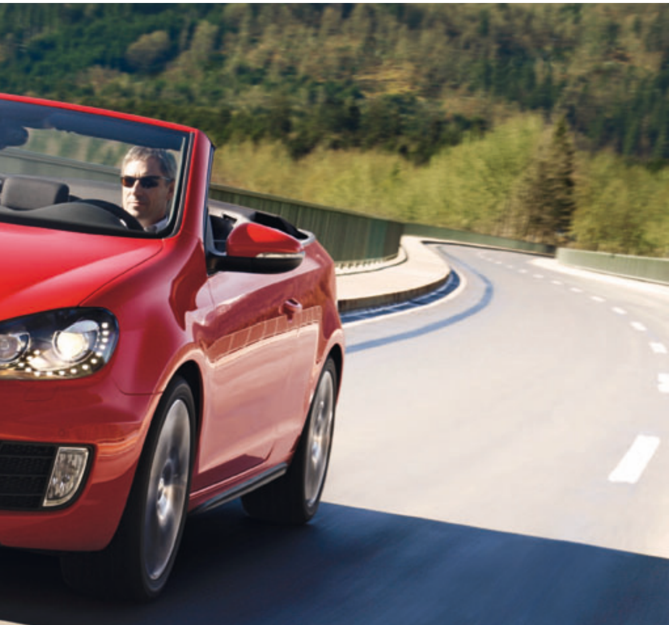
Golf GTI Cabriolet / Monaco / 2012 /